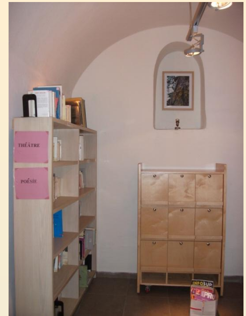
Kiosque « Orientation » (meuble + PC internet)